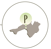
Area Prosecco DOCG