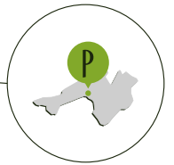
PROSECCO DOCG ZONE